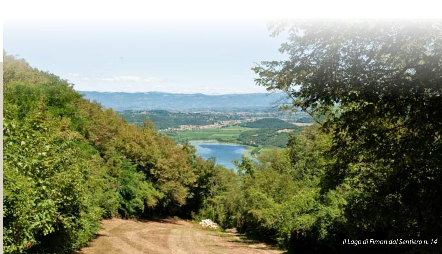
Il Lago di Fimon dal Sentiero n. 14

Oltre che in macchina ed in moto, i Colli Berici sono luogo ideale per essere visitati in bicicletta, mountain bike, a piedi, a cavallo lungo gli itinerari e sentieri proposti e mantenuti dal Consorzio. Possono essere infine anche sorvolati in deltaplano.