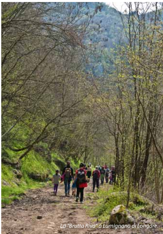
La "Brutta Riva" a Lumignano di Longare.